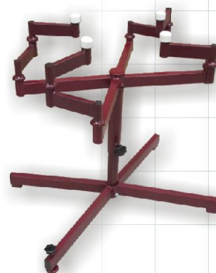
Table pivotante S1

Cette table est spécialement indiquée pour le giclage de petits éléments et d'échantillons dans des cabines de peinture. Grâce à son exécution robuste on peut peindre des pièces à travailler jusqu'à 50 kg sur cette table pivotante. Le palier pivotant est protégé des salissures par accumulation de peinture. Cette exécution est donc facile à faire pivoter.